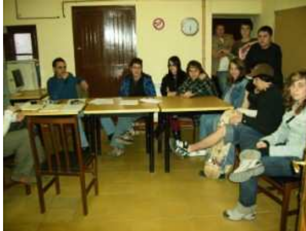
Imatges de la Trobada local de joves de Barberà de la Conca, març 2008