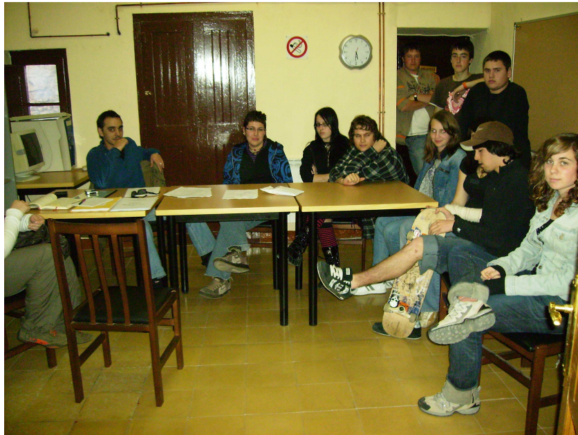
Imatge de la Trobada local de joves de Barberà de la Conca, dissabte 5 d'abril de 2008